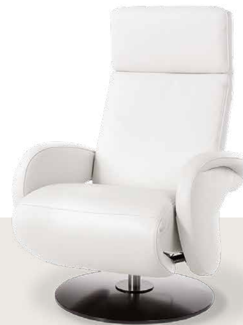
Bezug: Z73/43 cream white

Sitzkomfort empfindet jeder anders - und genau darauf geht das ergorelaxx -Programm ein. Das Kopfteil ist stufenlos verstellbar. Die Rückenlehnen lassen sich durch einfache Gewichtsverlagerung bequem nach hinten neigen. Weitere Verstellmöglichkeiten bestehen manuell (via Einsatz einer Gasdruckfeder) oder motorisch. Design: Wilhelm Bolinth