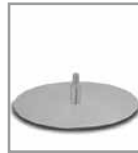
Drehteller, matt - FU 3, Aufpreis F PM