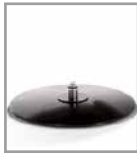
Holzteller, versch. Beiztöne - FU 2, Aufpreis F UZ