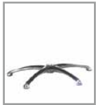
Sternfuß Chrom glänzend - FU 1 F SG