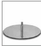
Drehteller, Chrom glänzend - FU 3, Aufpreis F PG