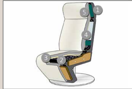
Das Design des hier abgebildeten Querschnitts entspricht nicht dem Modell dieses Katalogblattes.