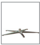
5-Sternfuß versch. Metallf.