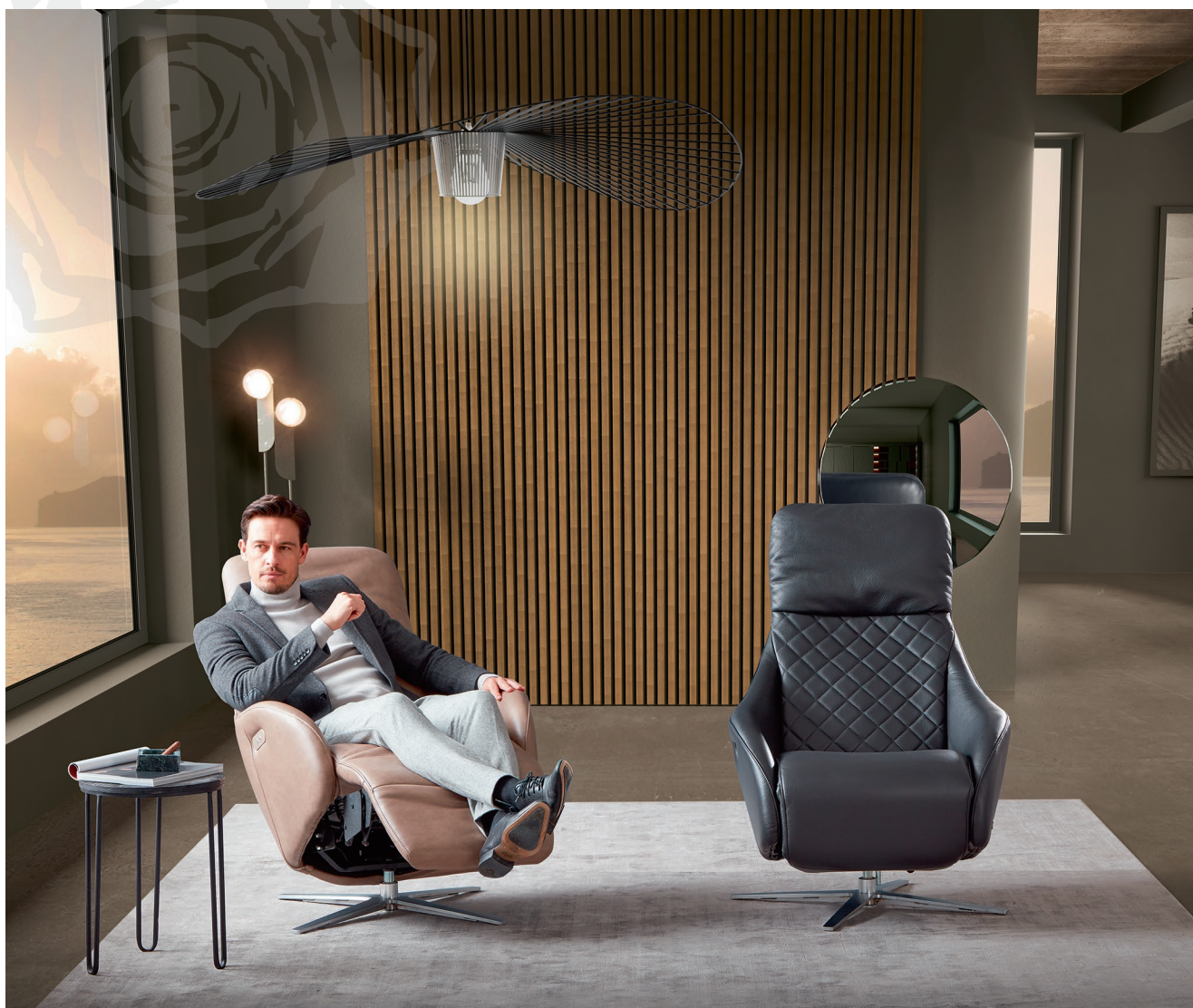
Bezug: Leder king in sand und Leder strong in black pearl

Je nach Situation, Bedarf und Ihrem Befinden können sich, wenn Sie wollen, integrierte elektrische Assistenten um Ihr persönliches Wohl kümmern. Von kleinen Verstellmotoren für die Kopfstützen bis hin zur Sitzheizung. Ohne jegliche Einbußen in puncto Gemütlichkeit unterstreicht sein klares Design auch optisch diesen technisch progressiven Anspruch.