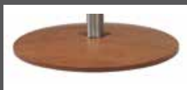
Drehteller aus Holz