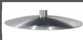
Drehteller in Edelstahloptik

(bei Leder sind aus technischen Gründen Nähte im Bezug!)