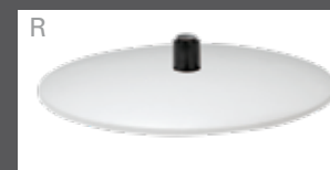
Bezogener Teller (Leder oder Stoff)