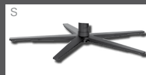
Metall-Sternfuß schmal - verchromt - Edelstahloptik - Anthrazit (pulverbeschichtet)