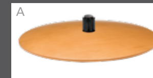
Holzteller in Buche (Farbe lt. Beiztonkarte)