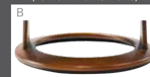
Holzdrehring in Buche (Farbe lt. Beiztonkarte)