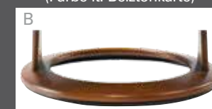
Holzdrehring in Buche (Farbe lt. Beiztonkarte)