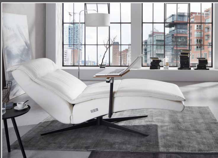
mit verstellbarem Rücken