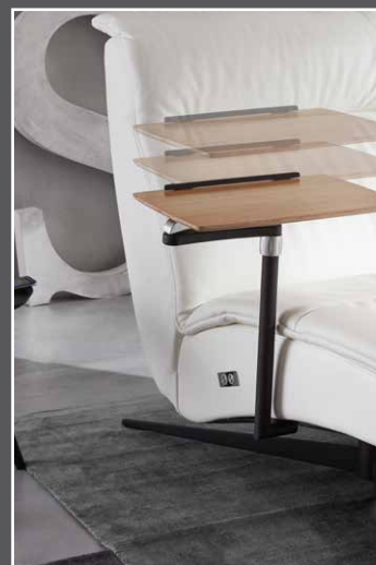
passender Tisch in verschiedenen Ausführungen erhältlich