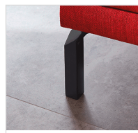
Schwarz (matt) Chrom Nr. 643 Nr. 644