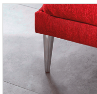
Chromfuß Nr. 617